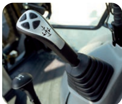
Control convenabil, ergonomic și precis

Monitorul LCD de înalta definiție de 7" este mai puțin afectat de unghiul de vizualizare și luminozitatea din jur, asigurând o vizibilitate excelentă. Diferitele alerte și informații despre utilaj sunt afișate într-un format simplu. Se oferă, de asemenea, informații utile, cum ar fi înregistrările de funcționare, setările utilajului și datele de întreținere. Operatorul poate comuta cu ușurință imaginile de pe ecran, folosind butoanele laterale intuitive.