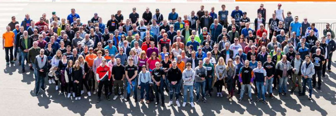
Fotografie de la evenimentul angajaților pe circuitul Red Bull Ring