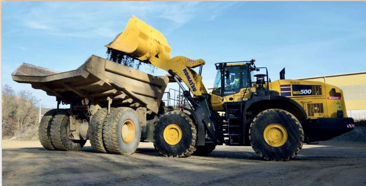
WA500-8Eo cu control precis și benă foarte eficientă, gata de utilizare, cu productivitate ridicată

ciată. Lafarge se bazează, de asemenea, pe colaborarea sa de lungă durată cu Kuhn.