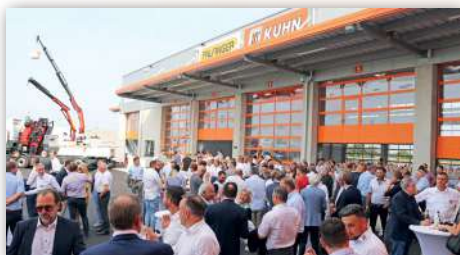
Aproximativ 250 de invitați au participat la ceremonia de deschidere din 22 iunie 2023

Primul reper important după fondarea Kuhn-Baumaschinen GmbH în 1973 a fost stabilit de Kuhn în 1986, odată cu preluarea reprezentanțelor generale ale macaralelor Palfinger și stivuitoarelor Mitsubishi, precum și cu fondarea Kuhn-Ladetechnik. Din acel moment, grupul de companii s-a concentrat pe specializare și pe o penetrare puternică a pieței. În 1990 a avut loc prima extindere internațională, odată cu fondarea Kuhn KFT în Budapesta. În același timp, alături de Mitsubishi, Kuhn devine lider de pia-