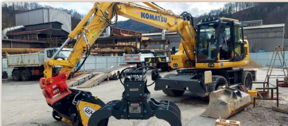
Fotografia prezintă livrarea unui excavator mobil PW158-11 cu benă și 2 brațe, direcție cu joystick și Powertilt. Pentru utilizarea perfectă a utilajului au fost achiziționate, de asemenea, o benă de betonieră Uemme Condor 450 și un clește de prindere pentru demolare VTN MD140.

WA470-8 și WA475-10, două excavatoare PC210NLC-11 și un PC360NLC-11, un excavator de mici dimensiuni și unul de dimensiuni mijlocii, Gradnje Žveplan d.o.o. și-a extins parcul de utilaje prin achiziționarea unui excavator mobil Komatsu PW158-11.